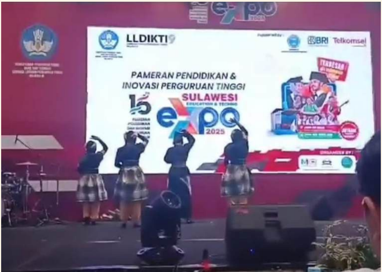
Sanggar Seni Saribattang SMKN 2 Jeneponto