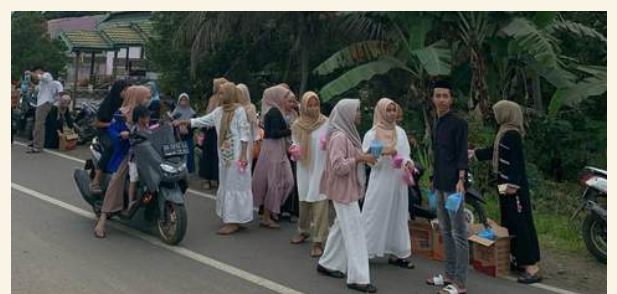
Desa Rumbia, Kec Rumbia, Kab. Jeneponto

Melalui semangat berbagi di bulan Ramadan, SMKN 2 Jeneponto ingin mencetak generasi yang tidak hanya unggul dalam kompetensi, tetapi juga luhur dalam budi pekerti.