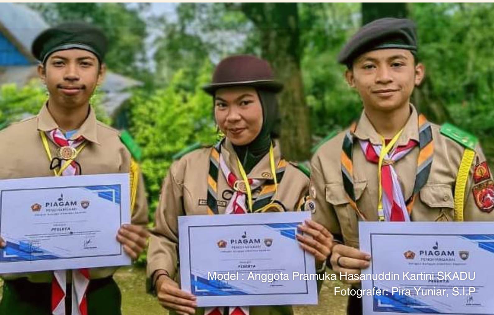
Model : Anggota Pramuka Hasanuddin Kartini SKADU

RAMADHAN TEBAR KEBAIKAN OLAH SAMBUT SAKA BHAYANGKARA LOMBA TARI KREASI SKADU INSIGHT ALUMNI INSPIRATIF DAN MEMBANGGAKAN TALI KASIH