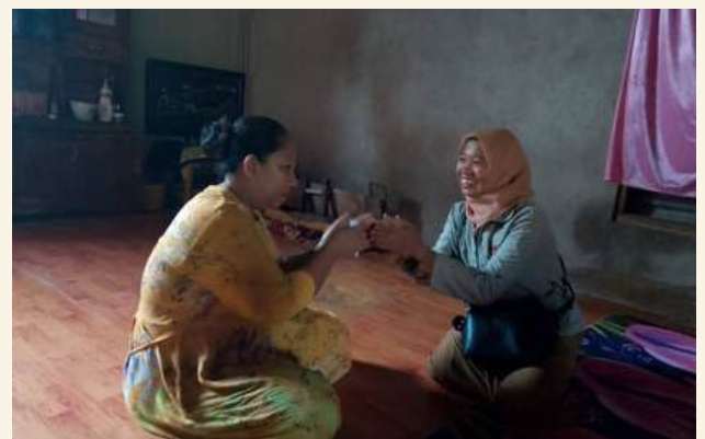
Desa Tombolo, Kec. Kelara, Kab. Jeneponto