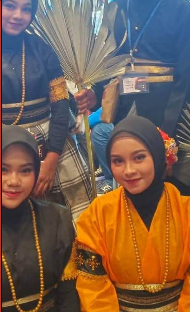
Sanggar Seni Saribattang smkn 2 Jeneponto Hotel Claro Makassar

Dukungan penuh dari pihak sekolah, pelatih, serta semangat luar biasa dari para siswa menjadi kunci utama kesuksesan ini. Kegiatan ini diharapkan dapat menjadi motivasi bagi seluruh warga SMKN 2 Jeneponto untuk terus berkarya dan berprestasi di berbagai bidang, baik akademik maupun non-akademik.