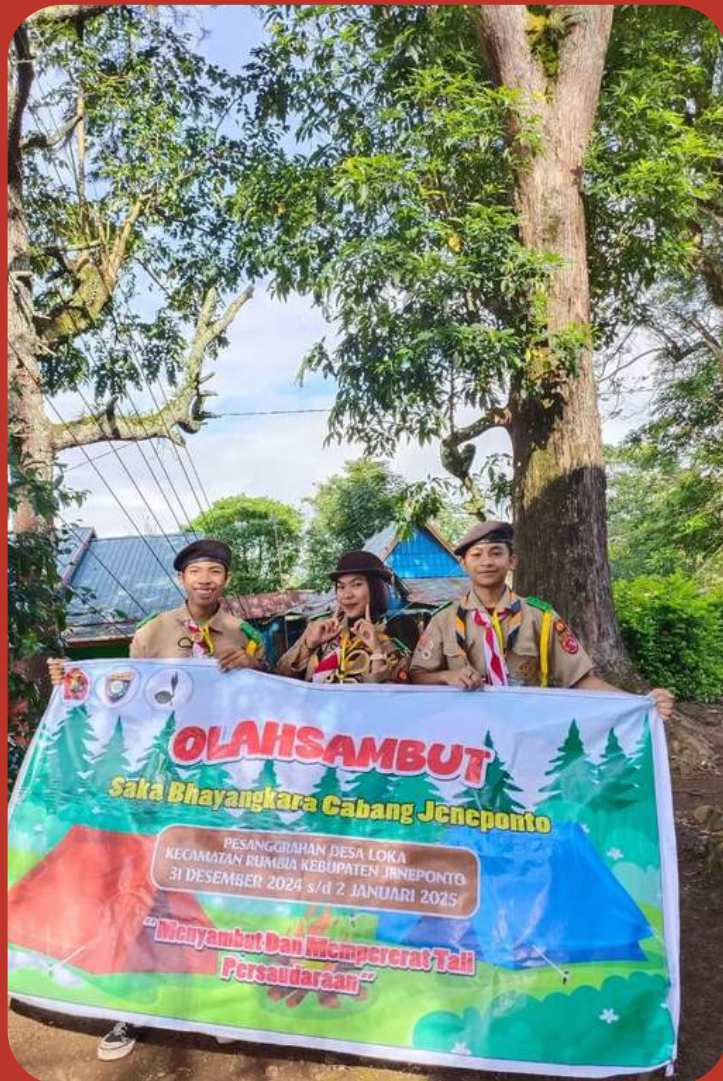
Desa Loka, Kec. Rumbia, Kab. Jeneponto